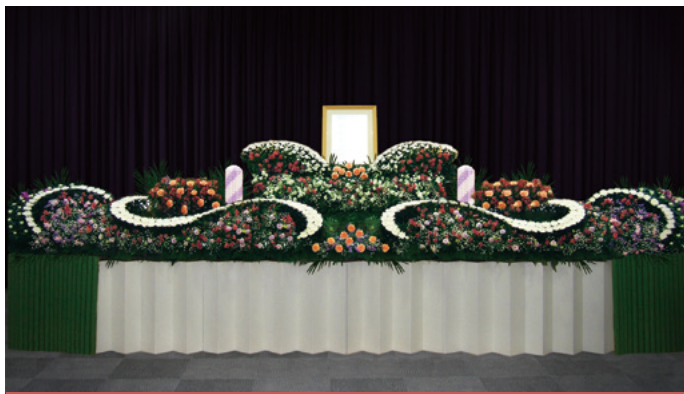
生花祭壇 幅約 5,400 (mm)