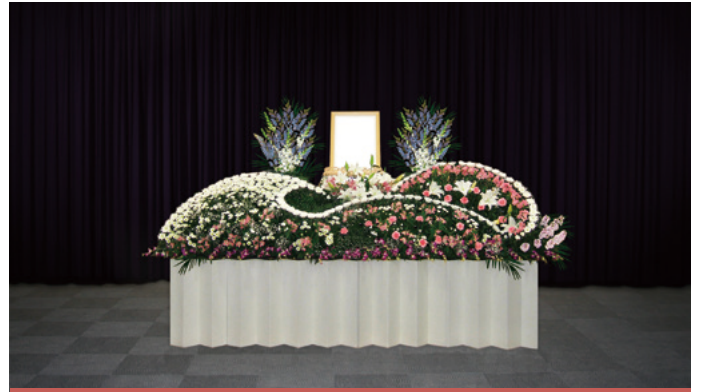
生花祭壇 幅約 2,700 (mm)