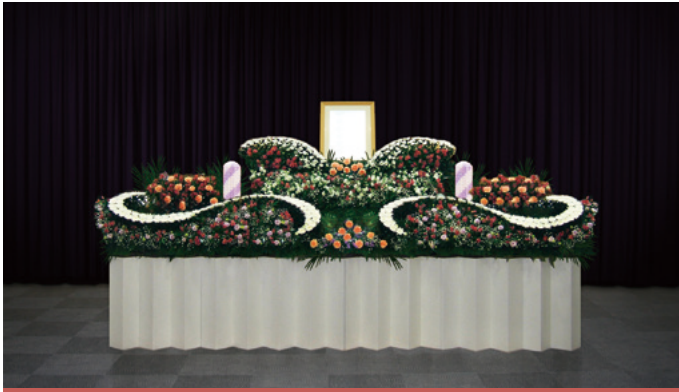
生花祭壇 幅約 3,600 (mm)