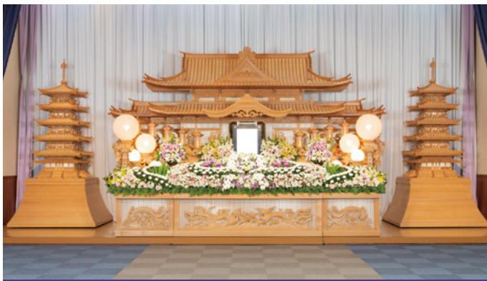
白木祭壇 高さ3,000x幅6,600x奥行1,500(mm)