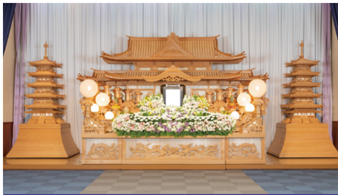
白木祭壇 高さ3,000x幅6,600x奥行1,500(mm)