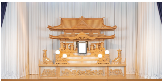
白木祭壇 高さ3,000x幅2,700x奥行き1,500(mm)