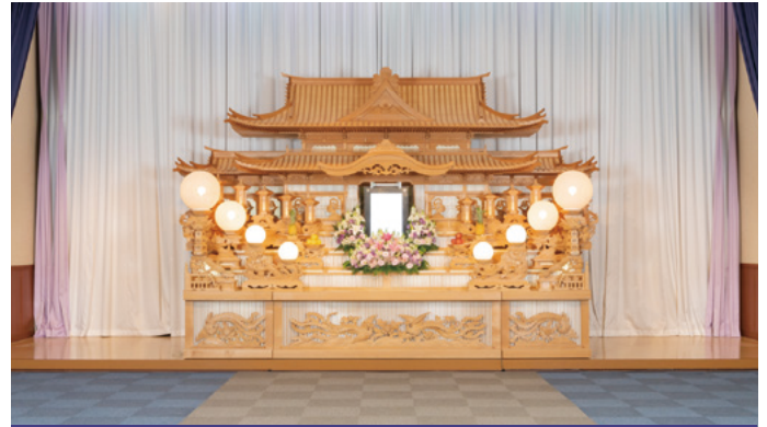
白木祭壇 高さ3,000x幅4,800x奥行1,500(mm)