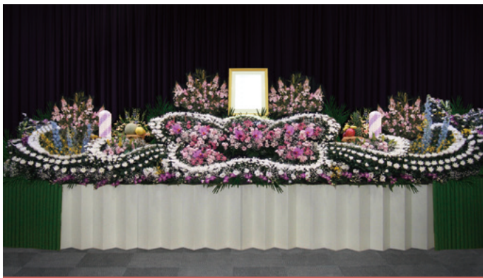
生花祭壇 幅約 5,400 (mm)