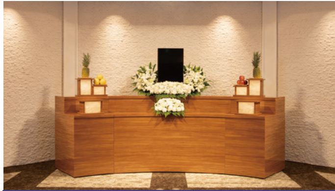
対応人数20名程度まで