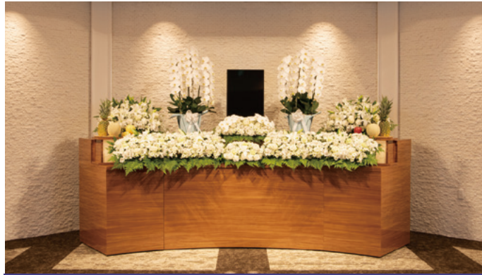
対応人数20名程度まで