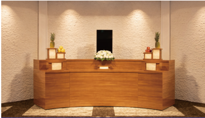
対応人数20名程度まで