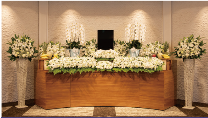
対応人数20名程度まで