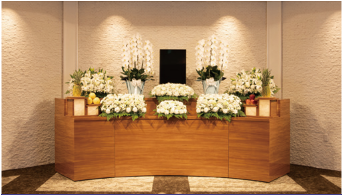
対応人数20名程度まで