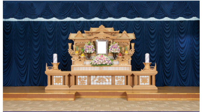
白木祭壇 高さ3,000x幅4,800x奥行1,500(mm)