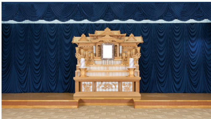
白木祭壇 高さ3,000x幅2,700x奥行き1,500(mm)