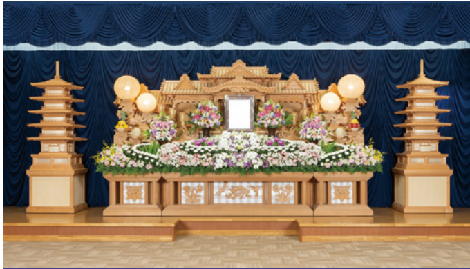
白木祭壇 高さ3,000x幅6,600x奥行1,500(mm)