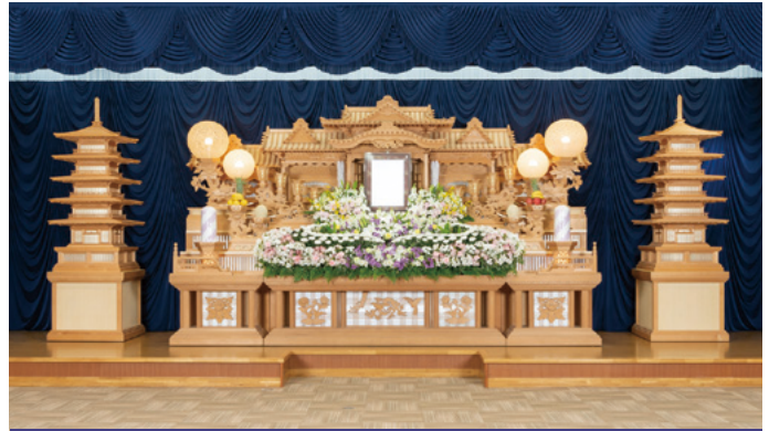
白木祭壇 高さ3,000x幅6,600x奥行1,500(mm)