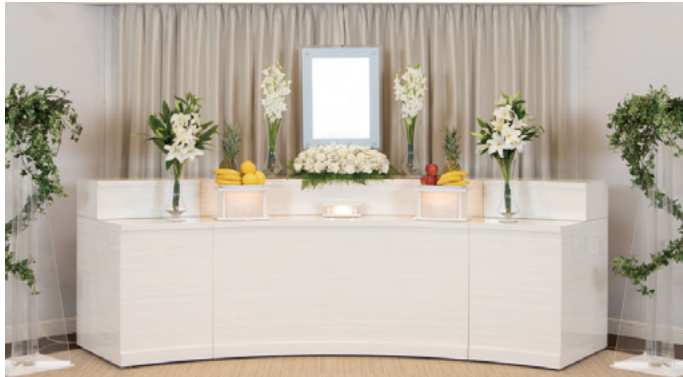
対応人数20名程度まで