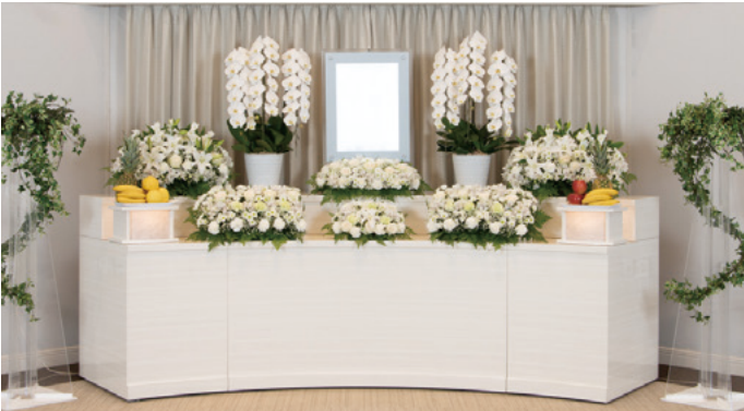
対応人数20名程度まで