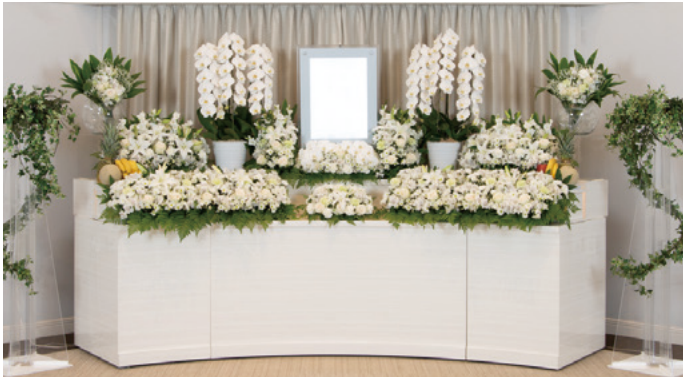
対応人数20名程度まで