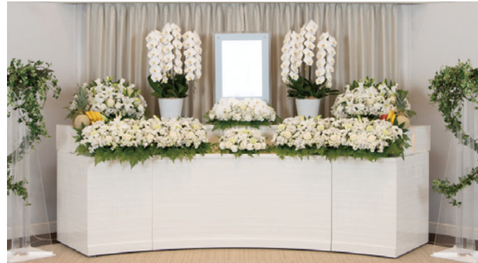
対応人数20名程度まで