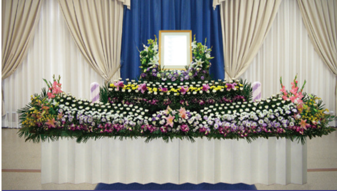
対応人数 30名程度まで