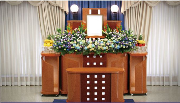
対応人数 30名程度まで