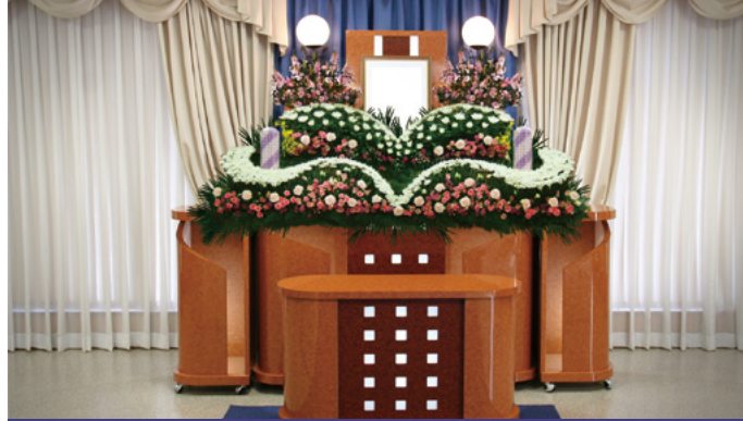
対応人数 30名程度まで