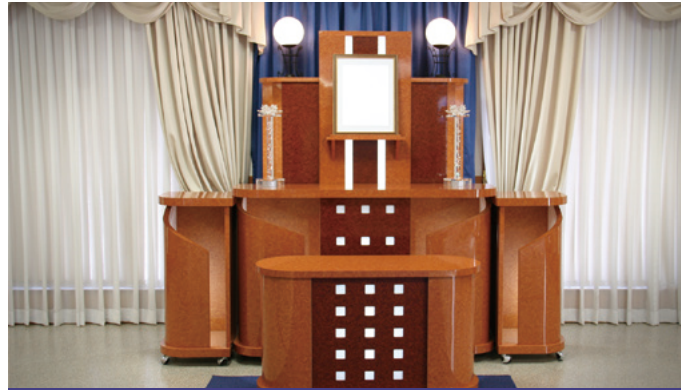
対応人数 30名程度まで