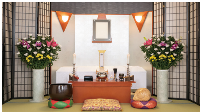
対応人数 10名程度まで ※生花は別途注文となります。