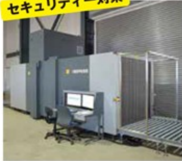
X線検査機は、10,620×3,481×3,116mmの大型機器。コンベアで商品を検査にかけ、物質識別機能により、自動的に有機物・無機物(金属類)・混合物を識別し、モニターに映す