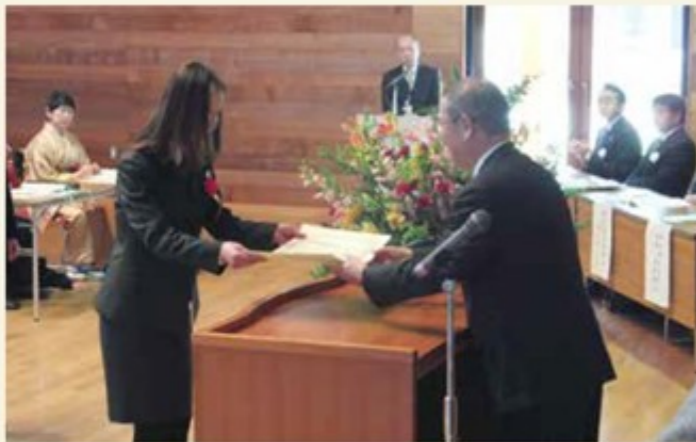
2013年2月8日、成田市社会福祉協議会にて表彰されました