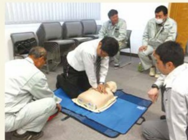
消防署の方の説明を聞きながら、皆真剣に取り組んでいます

各事業所にAED(自動体外式除細動器)を設置し、万が一の場合に、従業員はもちろんお客様、地域の皆様の人命救助に役立つよう設置しています。100名以上の従業員が普通救命講習を受講し、AED操作訓練を行っています。