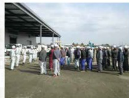
スピーディーかつ正確に工事を進めるには、朝のミーティングはもちろん、現場での綿密な打ち合わせや進捗確認も重要