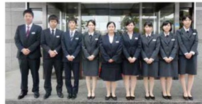
今年もフレッシュなメンバーが加わりました（本社前にて）