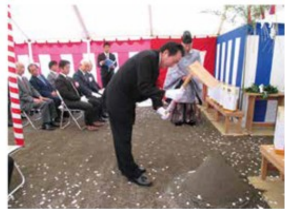
昨年9月吉日に行われた地鎮祭

くれる建設会社、長く付き合える企業という視点から、地元企業である当社に設計・施工をお任せくださいました。