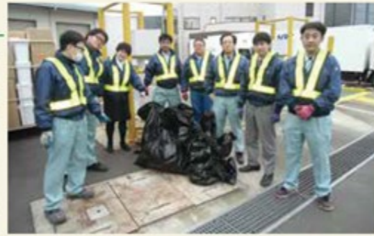
街がきれいになると、私たちの気持ちも晴れやかになります