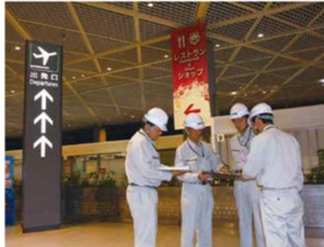
成田国際空港ターミナルビルでの作業前打ち合わせ風景。建築課でも安全・正確をモットーにメンテナンス業務を行っています

日本の表玄関である成田国際空港ですから、国内外から多くのお客様が往来する中での業務となります。また、お客様にご迷惑となる工事は深夜作業で対処します。昼夜を問わない業務のため、少数精鋭の若手社員がこのメンテナンス業務に当たっています。