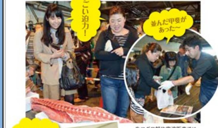
生マグロ解体実演販売では、とびきり新鮮な生マグロをゲット!