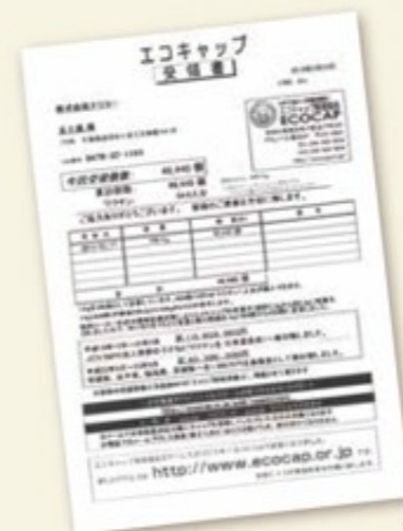
エコキャップの受領書