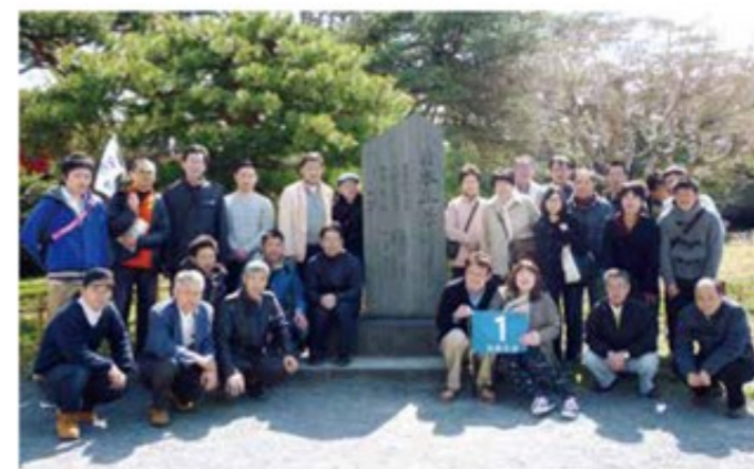
松島の日本三景碑前にて（1班）