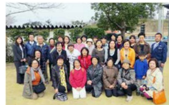
激戦となった抽選を勝ち抜いた、30名の参加者の皆さん