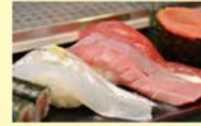
おまかせ握りは巻物1本、握り7貫に桜が付く(1,620円)

市場にオープンして30年。三代目の店長が握る寿司は、セリが始まると同時に仕入れに行き、一番いいところを選びすぐるので鮮度・味は格別だ。おすすめは「おまかせ握り」。毎日変わるネタは、なんとシャリをロールできるほどの大きさ!