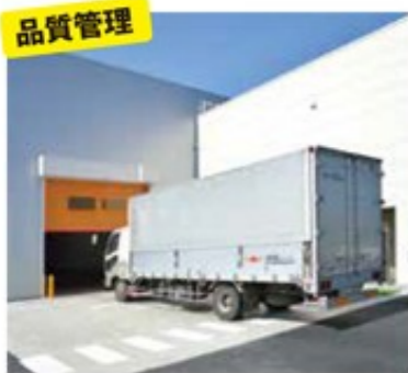
高速シートシャッター