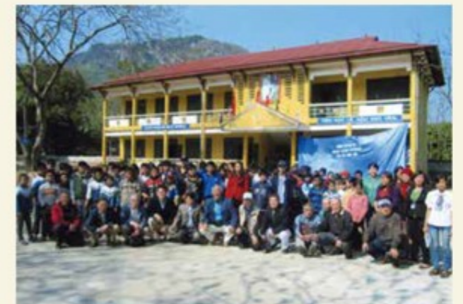
マイチャウ中学校の子どもたちと