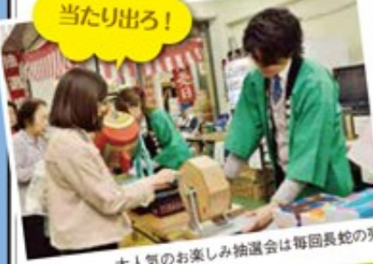
大人気のお楽しみ抽選会は毎回長蛇の列