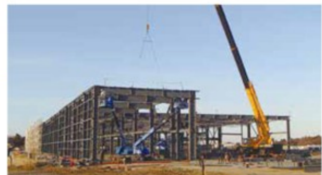
約4,000坪の敷地は、東京ドームのグラウンドとほぼ同じ広さ。延べ1万人の作業員が動員された