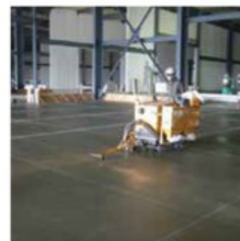
コンクリートのひび割れ防止のため、深さ3mm程度の溝をコンクリートカッターで入れていく