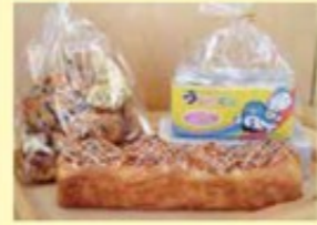
(右) うなりくんフィンランシェ(4個入500円) (左) チョコデニッシュ詰め合わせ(200円) (下) シナモンブレッド(200円)

お菓子工場直営の手作りパン・スイーツのお店。リーズナブルな価格に、バター風味としっとりとした食感が人気だ。9時前に品薄になるので、早めの来店がおすすめ。「わくわく」感謝デーには、毎回1,000円前後のお得なオリジナル商品が登場!