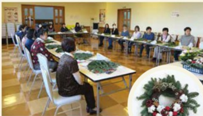
カルチャースクール(クリスマスリース作り)の様子