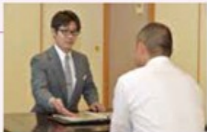
綿密なお打ち合わせ

宗派やご希望に合わせた葬儀を行うため、ご納得いただけるまで何度でもお伺いします。また、この時点で分かりうるすべての項目について詳細にお見積りいたします。