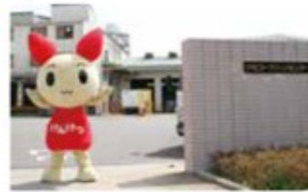
ナリコークリーンセンター前にて

4月の定期健康診断時に、献血を行いました。「ドナー通信」(千葉県赤十字血液センター編集発行)の「けんけつちゃんが行く! 献血協力企業・団体訪問」取材のため、献血キャラクターの「けんけつちゃん」が来てくれました。