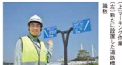
(左)マーキング作業 (右)新たに設置した道路標識板

主な業務 成田国際空港メンテナンス業務（路面清掃、路面標識塗装、草刈り、滑走路ゴム除去、除雪）