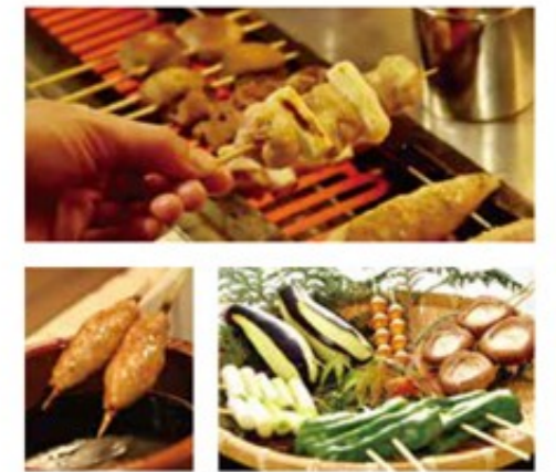
焼き鳥は秘伝のタレにつけてじっくりと焼き上げます。季節ごとに味わいに変化する野菜のおいしさも堪能ください