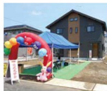
施主様の思いの詰まった住宅をお借りしての完成見学会。スタッフの説明にも熱が入ります

住宅見学会に積極的に参加いただき、直接ご自分の目でお確かめになることをお勧めします。