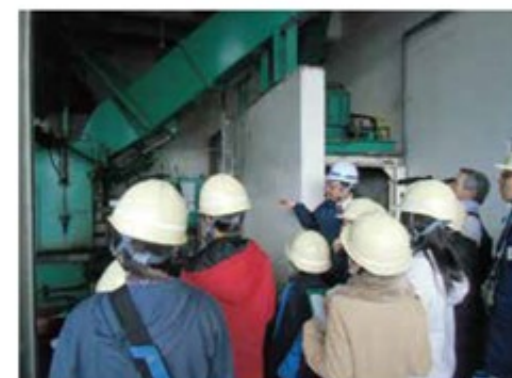
缶プレス機を見学