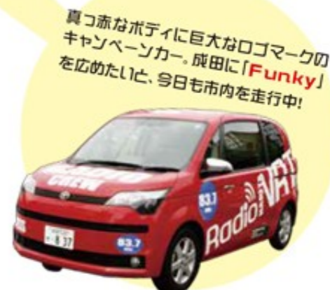
真っ赤なボディに巨大なロゴマークのキャンペーンカー。成田に「Funky」を広めたいと、今日も市内を走行中!

た東日本大震災。災害や交通トラブルの情報により地域に密着した形で発信したいと、震災後すぐ開局に向けた準備が始まったという。「周波数取得するのが困難でしたが、キャリアの豊富なパーソナリティーも揃い、成田市制施行60周年だった昨年末に開局が実現しました」と番組制作に携わるラジオ成田の森直宜さんは話す。