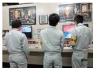
中央制御室で廃棄処理フローをチェック(第3事業部)