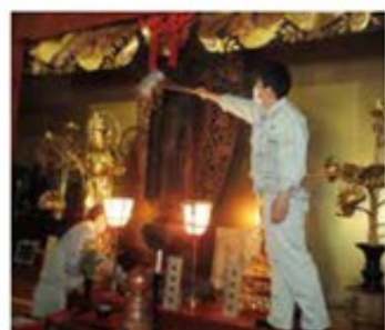
大慈恩寺での清掃(第4事業部)