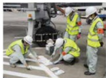
成田国際空港での標識工事(第1事業部)