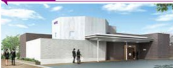
(寺台ホール敷地内)

家族葬ホール建設中！ 家族葬など、少人数でも使いやすいアットホームな式場づくりを進めています。