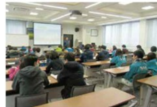
空港から排出される廃棄物についてDVDで学習

一般廃棄物の収集運搬及び中間処理(焼却)業務 産業廃棄物の収集運搬及び中間処理(焼却)業務 廃棄物のリサイクル業務