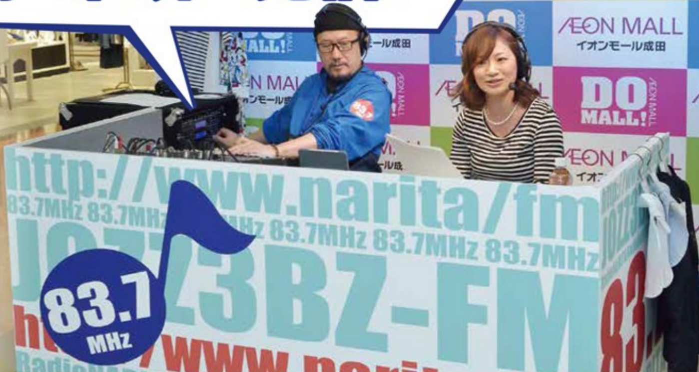
イオンモール成田サテライトスタジオで行われた公開放送