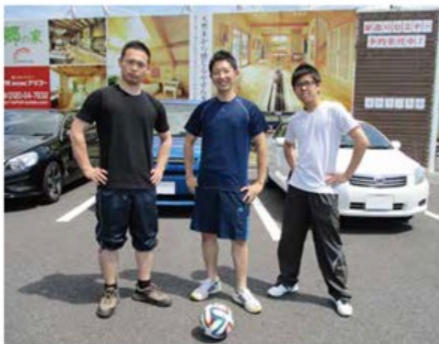
仕事を頑張った後のクラブ活動は良いリフレッシュになります。もっとたくさんの方と交流できる場を目指しています

チームでは、男女問わず、新入部員を大募集中です。気軽に練習をのぞきにきてください。もちろん対戦相手もお待ちしています。