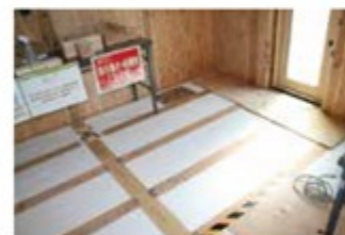
実際の構造をご覧いただける現場見学会。パネルなどでもその特徴を分かりやすく解説しています