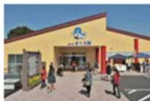
開館後は、地元の新鮮野菜や特産品を求める大勢の人でにぎわう