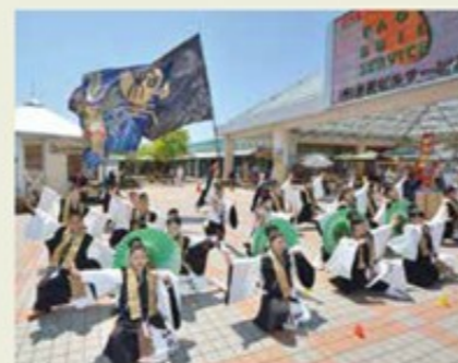
香取市を拠点とする「おみが和よさこい会 和気藤藤」によるパワフルな演技

よさこいを始めて7年。仕事の合間の練習や大会、イベント出演は良い気分転換になります。よさこいは幼稚園児から高齢の方まで誰でも参加できますが、チームワークが何より大切。そして、一人では決して味わうことのできない盛り上がりや達成感は最高です。以前、ご主人を亡くされたお客様を、よさこいの観覧にお誘いしました。そのとき涙を流して「後を追いたいほど辛かったけれど、生きる元気が湧きました」と言ってくれ、やっつけて良かったと思っております。