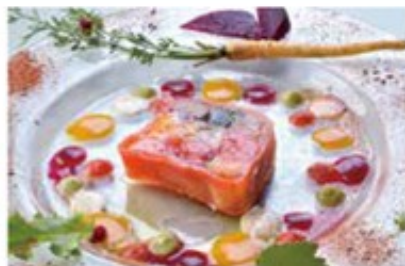
(上)一番人気の「10種類の富里野菜のテリーヌ」(1,200円+税込)。野菜ごとに調理方法を変え、長命泉の仕込み水と塩のみで味付けした逸品 (左上)2009年にオープン。東馬クラブを併設し、店内からはのんびりと草を食む馬の姿を眺めることができる (左下)広々とした店内。テラス席もお薦め