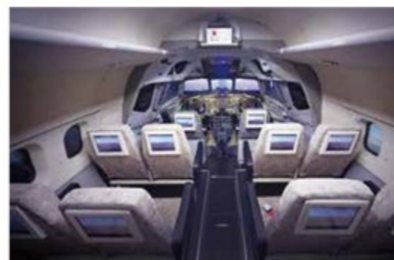
東京周辺など3つのコースをフライト体験できるDC-8シミュレーター

国内初の航空科学博物館で、ジャンボ機のパーツや19機の航空機を展示する。コックピットで操縦やシミュレーター体験ができ、パイロット気分が味わえると子どもたちに大好評。実物のボーイング747のガイドツアーは記念撮影にお薦めだ。3階展望台からは成田国際空港に着陸する飛行機を間近で眺めることができる。館内レストランでは機内食風のランチや軽食をいただける。