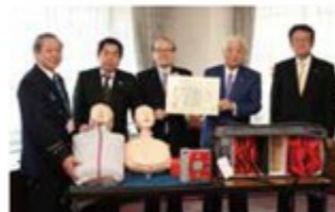
4月25日に成田市役所で行われた感謝状贈呈式

5月24日には、成田市立本城小学校5年生の生徒64名が、この資器材を使って心肺蘇生法を学びました。今後も、子どもたちが講習を受ける環境が整い、一人でも多くの方の人命救助につながることを期待しています。