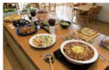
サラダはもちろん、煮物や揚げ物など30種類以上のメニューがあり、子どもも満足できる