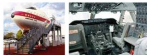
ボーイング747の機首部分(セクション41)。専門家による機内ガイドツアーあり