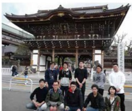
総門前で記念撮影

新入社員は1ヶ月間の新入社員研修を経て各部に配属されます。本格的な各部での研修を前に、昨年引き続き4月6日に成田山新勝寺で研修を行いました。護摩修行、座禅、写経など、普段はできない体験を一緒に行ったことで、同期の絆も深まりました。これらの経験を通じて養ったことを、今後の社会人生活に活かし成長してほしいです。