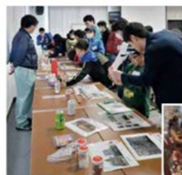
（上）ごみごどのようなものにリサイクルされるのか、実際に見て触れて学びます