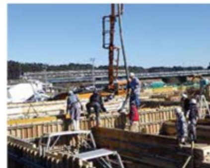
（左）本体棟基礎のコンクリート打設（2017年1月下旬） （右）本体棟ホール吹抜け部の空調配管施工（2017年3月中旬）

今後は公共工事にも携わる予定なので、書類作成や写真管理などの新しい仕事も増えてきます。いつか一人で現場を回せる監督になるのが夢です。