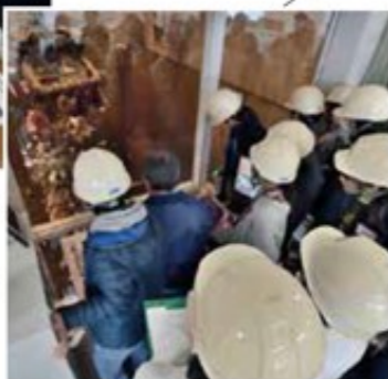
（右）中央操作室では、ごみを混ぜる巨大クレーンのダイナミックな動きに、子どもたちはくぎ付けです