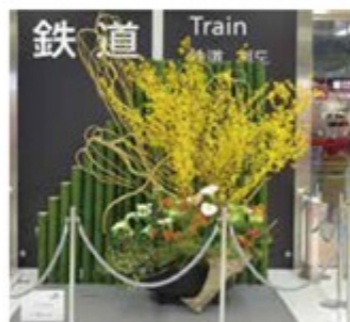
第2ターミナルに設置した、竹とレンギョウを組み合わせた存在感のある作品（2017年2月23日から3月8日まで） （上）出国手続き前エリア 3階中央 （下）本館 地下1階中央