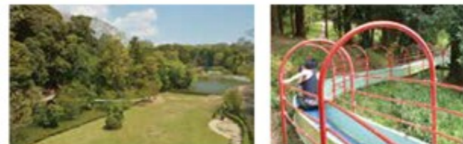
(左)公園内にかかる吊り橋から見る景色は広々として爽やかな気分が味わえる (右)公園のメイン遊具、ジャンボスライダー

5haの広大な坂田ヶ池を中心に整備された自然豊かな公園。アスレチックやバーベキュー場、キャンプ場のほか、全長78mのジャンボスライダーには子どもたちも大興奮！お尻に敷く段ボールを忘れずに。緑がまぶしい芝生の広場は、バドミントンをしたり追いかけっこをしたり、家族で思い切り遊ぶのにぴったり。たっぷり体を動かしたら、バーベキューでお腹を満たそう。