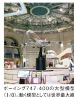
ボーイング747-400の大型模型(1/8)。動く模型としては世界最大級