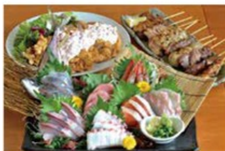
刺身の盛り合わせ「まいもどり」(1人前1,480円、写真は2~3人前)。おまかせ串焼き10本盛り合わせ(1,200円)。宴会メニューは3,500円から ※メニューは全て税別。