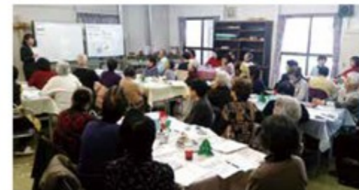
昨年12月に栄町電角寺台で開催した終活セミナー