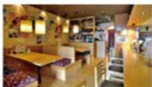
(上)壁に並ぶちょうちんがユニーク (下)清潔感のある店内