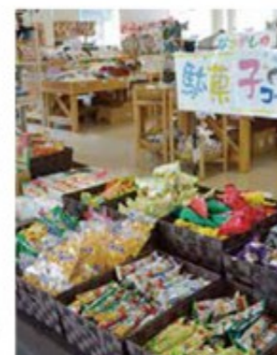
産直野菜や駄菓子、うなりくんグッズなどがそろう

飛行機の撮影スポットとして有名な成田市さくらの山に併設する観光物産館。地元の生産者が毎朝運んでくる採れたての野菜や、焼きたてのパンが人気だ。駄菓子コーナーや無料の休憩所もあり、子ども連れのファミリーにもうれしい。また、館内にあるフライトショップ・チャーリーズには、他では手に入らない航空グッズがいっぱい！ぜひチェックしよう。