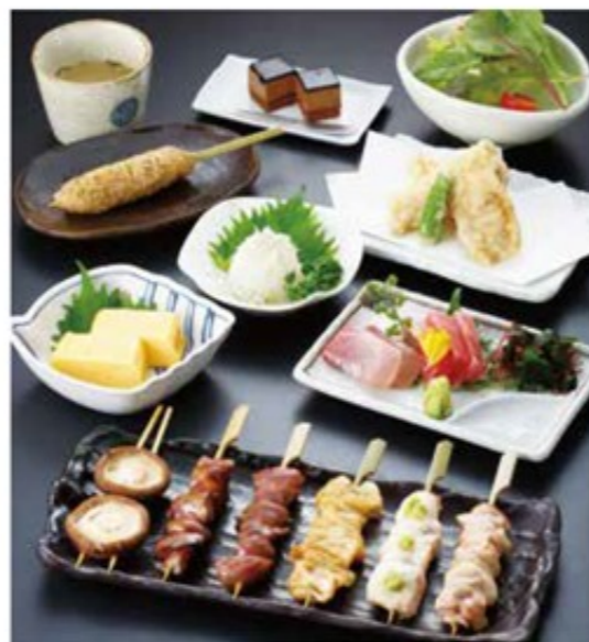
錦爽どりのコース