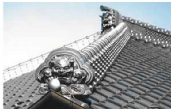
(左) 根木名川橋に設置されている下総鬼瓦。表情にはどこかくすみを感じられる。 (右) 鬼瓦は古代から魔除け、招福、繁栄の護りとして用いられ、阿吽の一對で屋根に飾られていた。