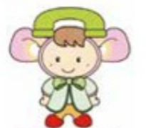
富里市消費生活センター マスコットキャラクター「とみりん」

クイズやワークショップなどを通して、消費者トラブルや詐欺などの状況を知ることができるイベントです。子ども警官制服体験や無料法律相談なども行われるので、家族で参加して防犯意識を高めましょう。「とみさと市民活動フェスタ」も同時開催。